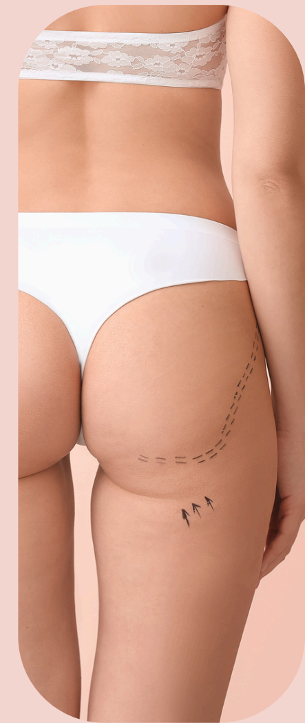
Glutei e cosce