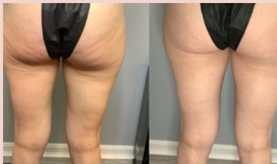
Riduzione del grasso delle gambe