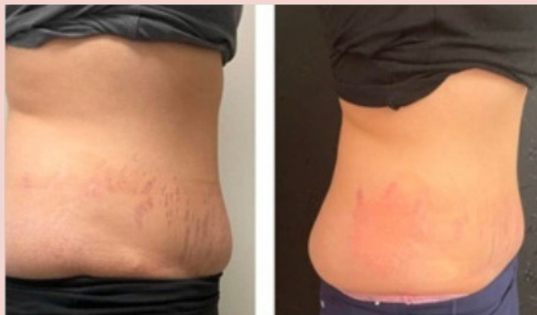
Scolpire e sollevare