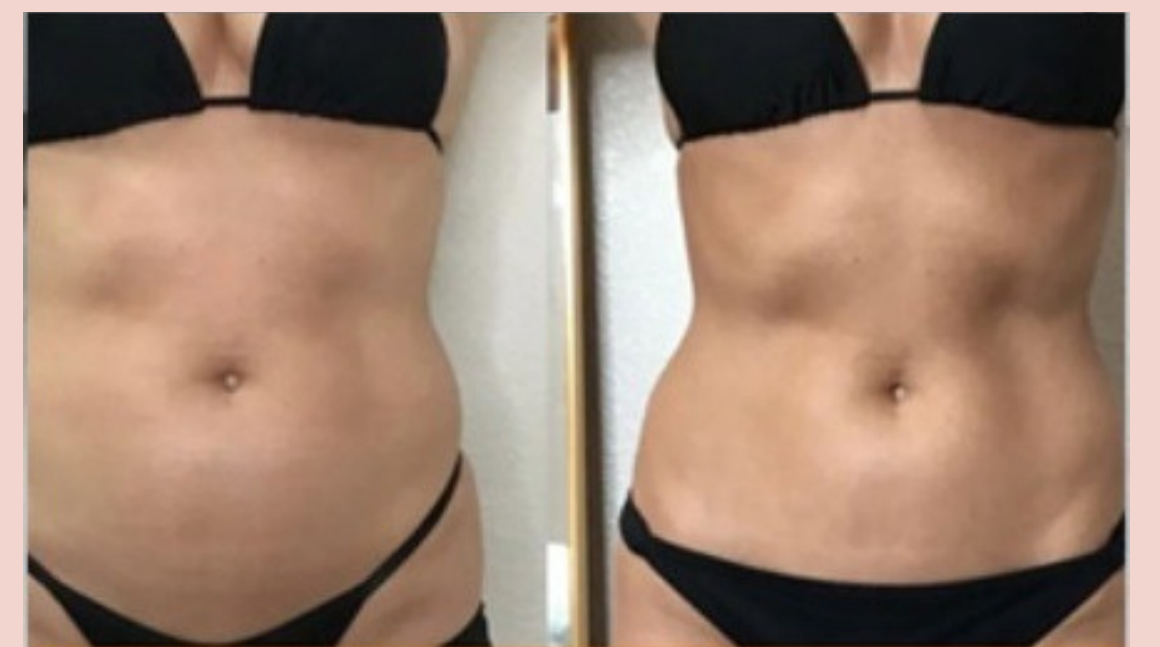
Scultura del corpo